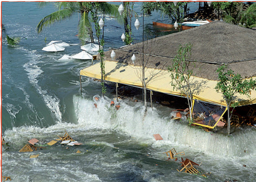
Tsunami en Indonésie le 26 décembre 2004

www.tsunamiwave.info Centre international d'information des tsunamis