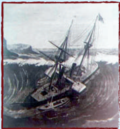
Earthquake Engineering Research Center, UC Berkeley

La première vague n'est pas forcément la plus dangereuse. Les vagues peuvent se manifester pendant plusieurs heures.